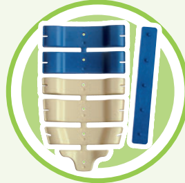
extrem flache 6-gliedrige Rücken- pelotte mit Stabili- sierungsstab

In der ersten Therapiestufe werden eine entlordosierende Position und ein abdominaler Druck durch die 6-gliedrige Rückenpelotte mit Stabilisierungsstab erzielt. Der Druck auf die erkrankte Bandscheibe wird reduziert , und die betroffenen Bewegungssegmente werden entlastet . Die Bewegung ist stark eingeschränkt, Rotationen sind nur noch bedingt möglich.